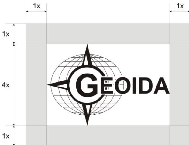
Rys.3 Logo Stowarzyszenia wraz z obszarem ochronnym

mniejsza względnie niż 5% odpowiednio wysokości i szerokości nośnika (wyświetlanego pola) oraz bezwzględnie 10mm wysokości dla nośnika oraz 50px wysokości w przypadku wyświetlania. Stosunek wysokości logo do jego szerokości wynosi 1:1,5