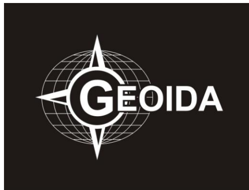
Rys. 5.1 Logo Stowarzyszenia - Monochrom. w kontrze