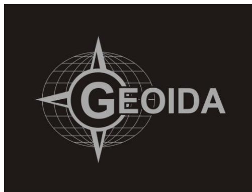
Rys. 4.2 Logo Stowarzyszenia - Monotone w kontrze