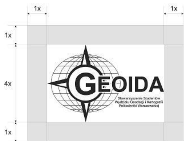
Rys.4 Logo Stowarzyszenia z podpisem wraz z obszarem ochronnym